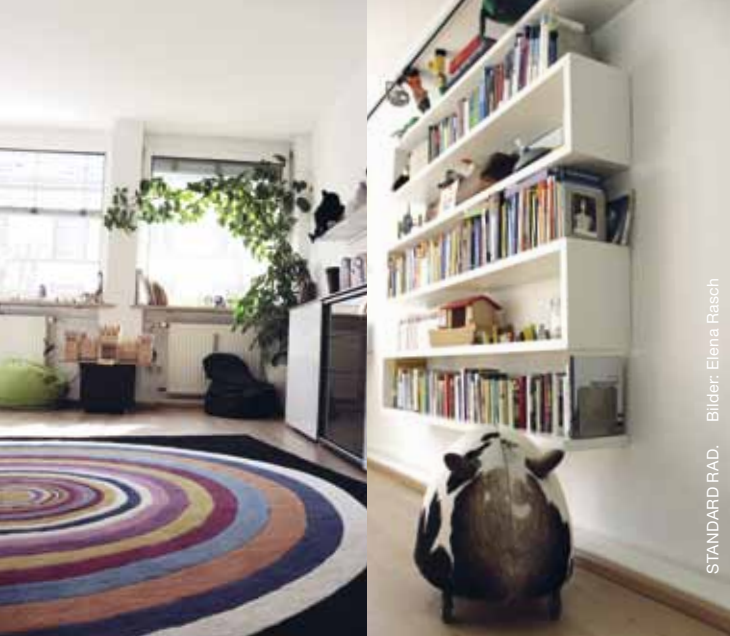
STANDARD RAD.

Ich weiß deine Monster sind genau wie man und mit denen bleibt man besser nicht alleine. Wir sind Helden